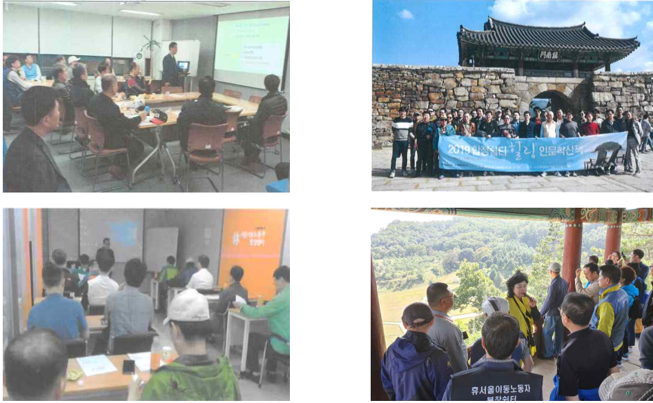
자료: 서울노동권익센터 사업실적보고서