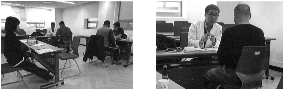
[그림 6] 이동노동자쉼터 상담사업 진행 모습