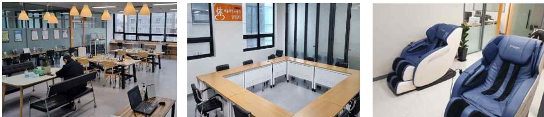
[그림 4] 휴서울이동노동자쉼터 휴게공간 및 편의시설

이동노동자쉼터의 가장 기본적인 기능은 휴게 편의 제공이다. 전국의 이동노동자쉼터는 버스광고, 홍보물품 배포 등 대시민 홍보활동을 통해 지속적으로 쉼터를 알려내고, 상담 및 교육 프로그램을 안정적으로 운영하며 쉼터 이용자를 지속적으로 증가시키려는 노력을 하였다. 예를 들어, 서울시의 휴서울이동노동자 북창쉼터는 17년 2월에 퀵서비스 기사 밀집지역인 장교동에 설치한 이후 18년 4월에 북창동으로 이전하면서 퀵서비스 기사들의 접근성이 떨어져 이용자 수가 다소 감소하였으나 서울시청을 중심으로 사무실 밀집 인근에서 업무를 수행하는 퀵서비스 기사들이 신규 유입되면서 기본 1일 방문자 수가 45명대를 유지하고 있다. 휴서울이동노동자 합정쉼터는 2017년 11월 29일 야간쉼터로 개소한 이래 2018년 3월 5일부터 주간운영을 시작하여 운영시간을 09:00~익일06:00로 확대하였다. 사실상 24시간 체제로 운영하고 있으며, 이에 따라 쉼터의 주 이용대상이 대리운전 기사에서 음식배달 종사자, 학습지 교사 등 취약계층 노동자 전반으로 확대되고 있다. 또한 2022년 합정쉼터 공간을 이전, 확대하면서 무료 공유작업공간을 조성하고 디지털 플랫폼과 단기계약을 맺고 일회성으로 일하는 초단기 노동자(직 워커)까지 쉼터 이용을 확대하였다. 작업공간 외에도 프리랜서가 대부분인 직 워커들을 위한 노동법 교육과 법률·세무상담 등도 정기적으로 진행하고 있다. 특히 직 워커에 꼭 필요한 지적재산권 보호교육과 계약분쟁 관련 상담, 종합소득세 등 세금 관련 컨설팅 등 특성을 반영한 밀착 지원도 하고 있다.